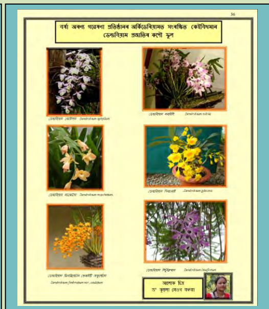
"वर्षारण्यम्" हिन्दी और असमीया ई-पत्रिका "Varsharanyam" Hindi & Assamese E-magazine