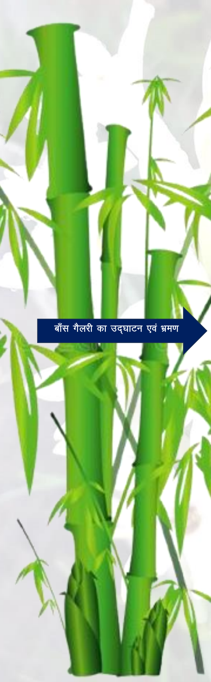
बाँस गैलरी का उद्घाटन एवं भ्रमण